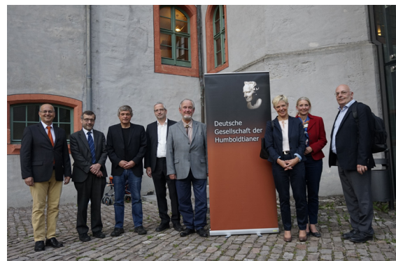
Gründungstreffen der Regionalgruppe Jena