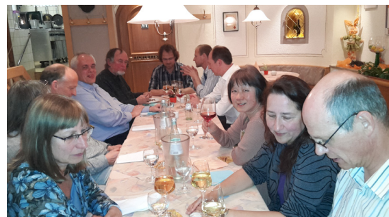
Abendlicher Ausklang des Treffens