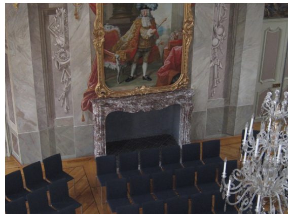
Blick in den Erbdrostenhof

dern in 18 Regionalgruppen hat die DGH bewiesen, dass „humboldtianisches Leben vor Ort“ nicht nur von Dauer ist, sondern einen wichtigen Beitrag zum akademischen Leben in Deutschland leistet und Humboldtianer darüber hinaus bereit sind, sich auch gesellschaftlich zu engagieren. All das wäre natürlich ohne die Unterstützung der AvH nicht möglich gewesen und deshalb wollen wir zusammen diesen runden Geburtstag feiern. Alle Humboldtianer und alle Freunde der AvH und DGH sind dazu herzlich eingeladen!